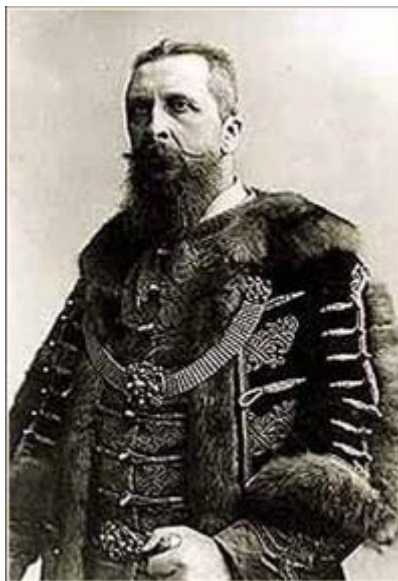
Apponyi Albert - Csak a hivatalos tanterv alapján tanítsanak